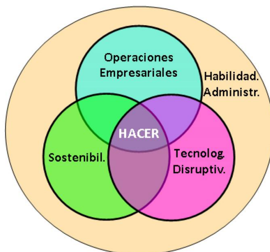
Figura 2 Modelo base de la carrera “Administración Empresas énfasis Operaciones”.

El modelo de nuestra carrera se fundamenta en el pilar del «Hacer» (ver Figura 2). La PPD no es una mera pasantía; es la transición del conocimiento abstracto hacia la resolución de problemas complejos en entornos reales de manufactura y servicios. El practicante es instado para actuar como un agente de cambio que aplica herramientas técnicas y administrativas para transformar procesos operativos bajo la rigurosidad de la Industria 4.0 y 5.0.