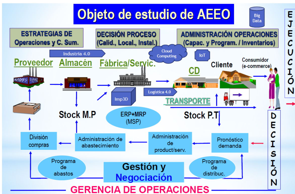
Figura 3. Esquema para caracterizar el objeto de estudio de la carrera AEE0

Los proyectos de intervención pueden alinearse con los 6 ejes y sus temas de referencia bajo cada uno (ver Anexo 3). También se considera el interés de las organizaciones en que se desarrollen proyectos propios del contexto laboral donde ellos compiten como parte del mercado laboral. Lo anterior, basado en que la práctica para ser autorizada ha de ser en el área de Operaciones (ver figura 3).